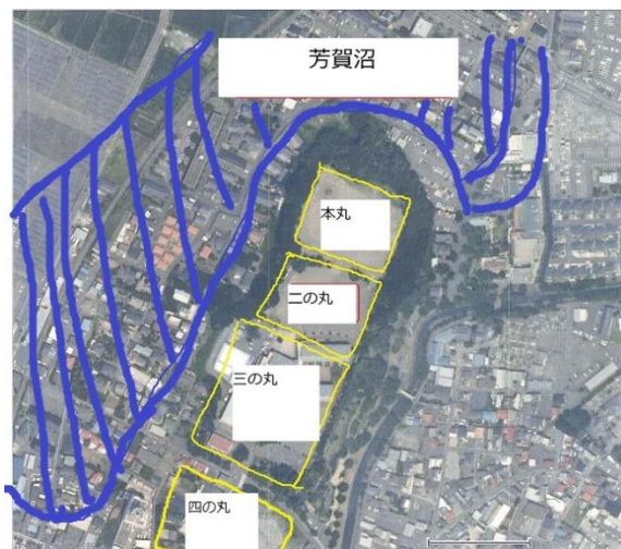
(広沢雅信作成 勝手に真岡城！？あくまでも参考)

芳賀高継は後北条氏の侵攻に備えるべく堅固な城を1577年に現在真岡小学校、城山公園付近に築城。築城にあたり人夫は那須、塩谷、壬生、宇都宮からそれぞれ200人を徴発し、日数は200日を要したという。その規模は東西約230m、南北約360m。本丸は台地最北端、南に二の丸、三の丸、四の丸を持ち、直ぐ脇の行屋川を堀とし、芳賀沼が城の北から西へと囲んでいる。いずれも10mの急崖をなしています。