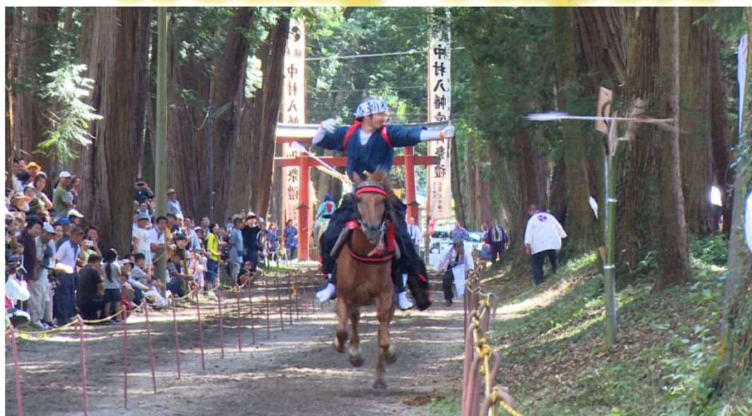
【真岡市 中村八幡宮例大祭 流鎧馬】