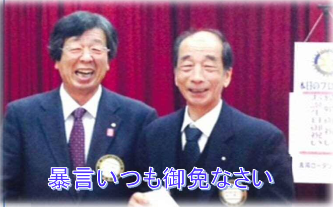
暴言いつも御免なさい