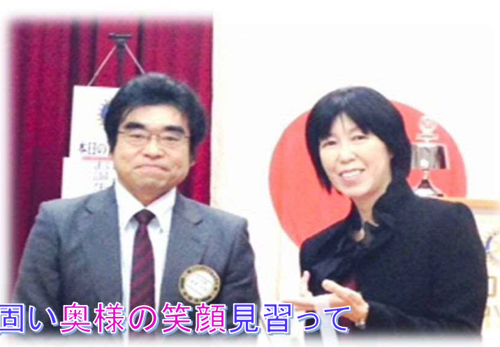
佳寛君固い奥様の笑顔見習って