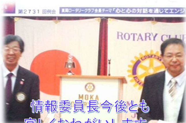
情報委員長今後とも 宜しくおねがいます。