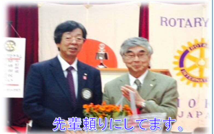
先輩頼りにしてます。