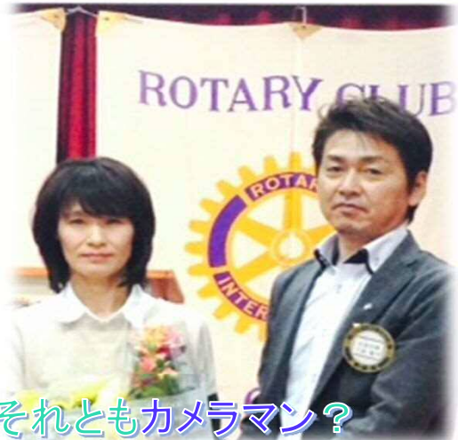
ちょっと賢ちゃん決まり過ぎそれともカメラマン?