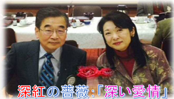
深紅の薔薇:「深い愛情」