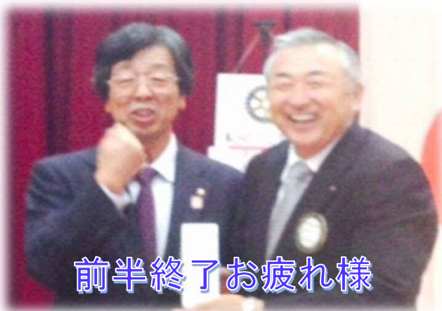
前半終了お疲れ様