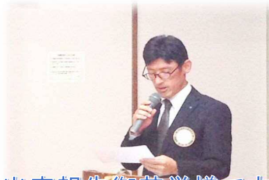
出席報告御苦勞様です。