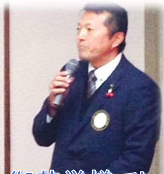
副SAA御苦勞様でした。