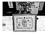
第19回地区親善野球大会ブロック優勝